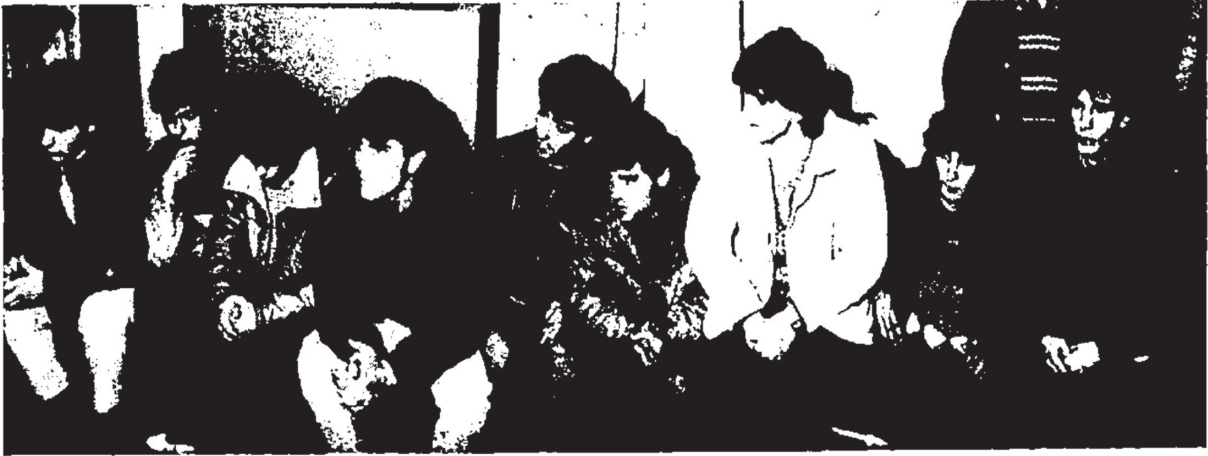
Τα «θήματα» καρίσταναν χτες στους δημοσιογράφους οι 9 νεοφασίστες, αφήνοντας στην άκρη «νταηλίτσια» και «άγριο ύφος». Καμαρώστε τα θρασύδελα «αντράκια»!

Ένα από τα ρεπορτάζ του Ριζοσπάστη για τη δολοφονία Ευαγγελόπουλου.