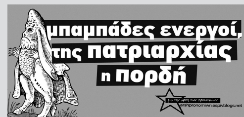
Αυτοκόλλητο της Άρης Προνομιών, Απρίλιος 2021

Μία από τις δεκάδες χρηματοδοτούμενες διαφημίσεις των “Ενεργών Μπαμπάδων” στο κέντρο και σε συνοικίες της Αθήνας. Ωστόσο, η εκστρατεία από πλευράς ανδρικών ομάδων είχε και την κινηματική της πλευρά, όπως το εικονιζόμενο πανό σε αερογέφυρα, που εμφανίστηκε και σε μορφή συνθήματος από την Καισαριανή μέχρι το Χαλάνδρι και τα Πετράλωνα - μια χρήσιμη ένδειξη για το πώς δουλεύουν “τα κινήματα” με κρατική υποστήριξη στον 21ο αιώνα.